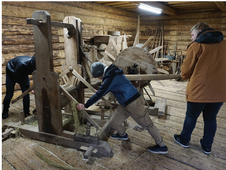
Luudusmaja aidan saap suure massinege lina murda.

Rogrammi om kokku pant mitmest jaost. Kigepäält om väike jutusõõr Mulgimaast. Latse saave kaardi päält selges, kus Mulgimaa om, mitu kihelkunda siin om, mis om rahvarõövaste man esierälikku, kust om Mulgi nimi tullu, millege mulgi rikkas saive ja mida tähendeve värv Mulgi lipu pääl. Latse tutvusteve endit kah mulgi keelen. Sis vaadetes tillikest vilmikest linatüüdest ja jagates latse viies kihelkunnas. Övven akkave kik rupi oma tüüsit tegeme. Üte saeve katemehesaage puid ja riivive kapstid, tõise söödäve kodujännessit ja obesit, kolmande niidäve einä, teeve akkurige peenikes ja viive kanadele, nelläs rühm akip kartult ja söödäp kitsi-lam-