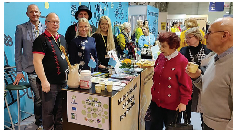
Veebruarikuul käisive mulgi oma kandist kõneleminen ja oma kaupa pakman nii Balttouri messil Riian ku Tourestil Talnan. Pildi pääl mulke punt Tourestil.