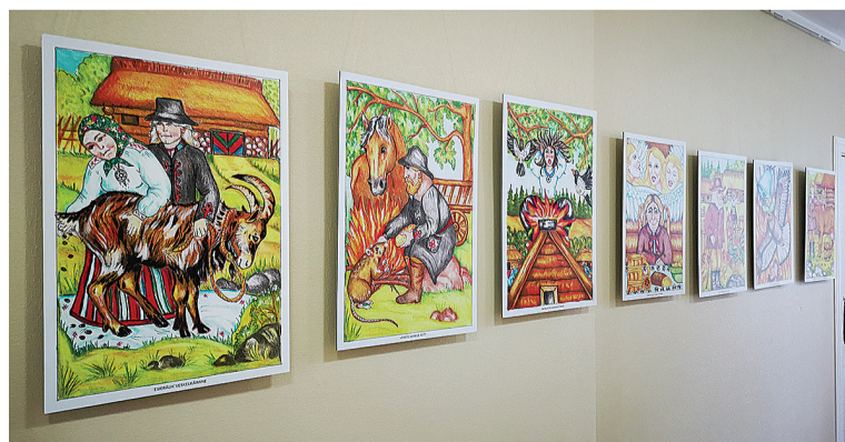
Minevaaste septembrekuul olli näitus “Ämäriguaa luu pilte pääl” vällän Tarvastu raamatukogun.